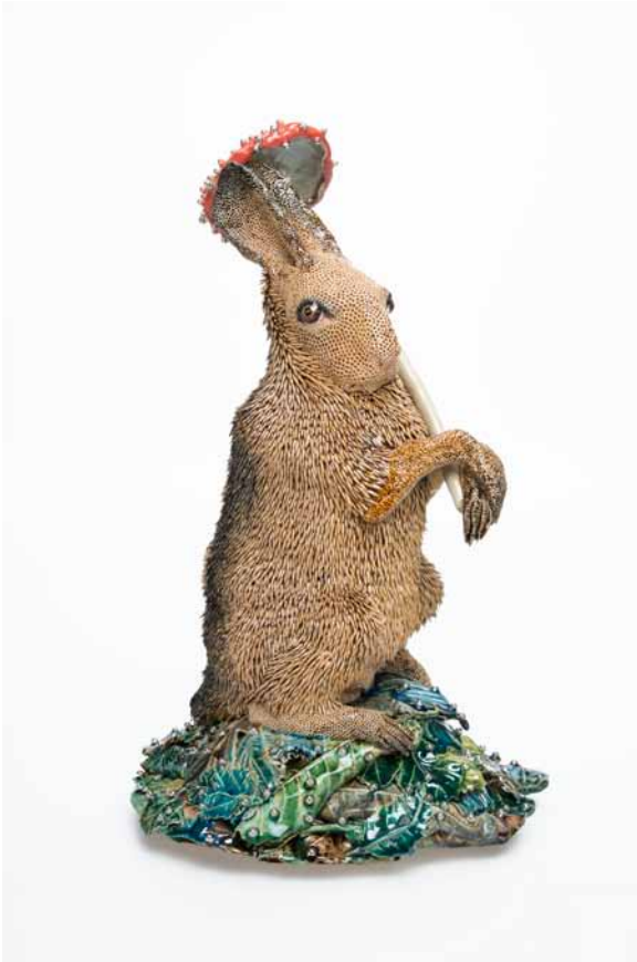
HARE (HAAS MET PARASOL)

Faïence émaillée / Glazed earthenware ceramics Pièce unique. 24 x 29 x 46 cm, 2016