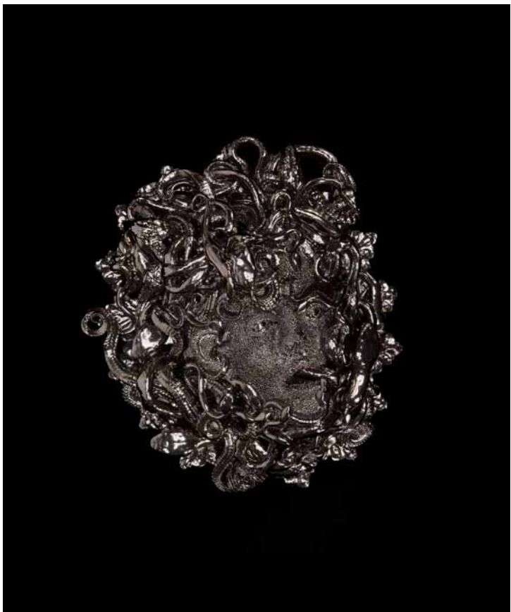
BRONZE COLORED MEDUSA

Faïence émaillée / Glazed earthenware ceramics Pièce unique. h 10 x L 36 x l 21 cm, 2017