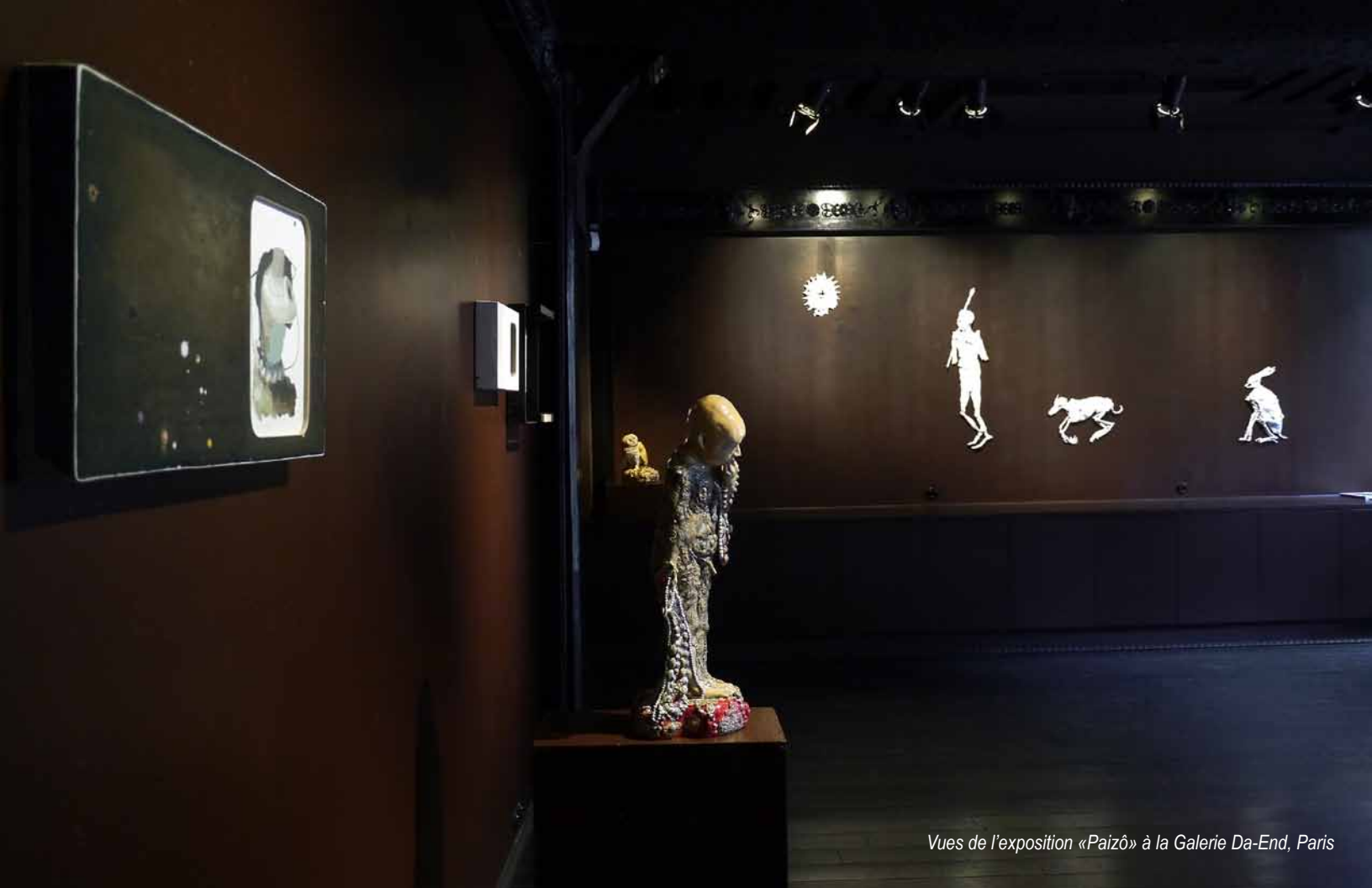
Vues de l'exposition «Paizò» à la Galerie Da-End, Paris