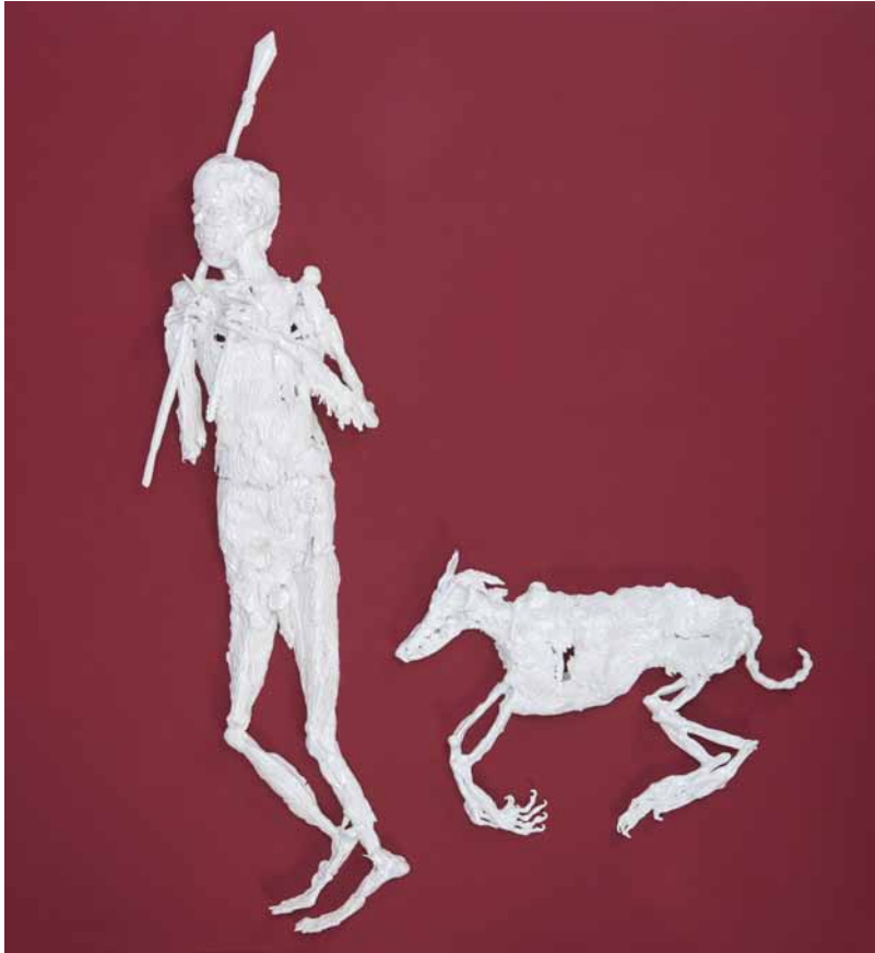
HUNTER AND ITS DOG (JAGER EN ZIJN HOND)

Faience émaillée / Glazed earthenware ceramics Pièce unique. 109 x 30 cm & 34 x 52 cm, 2017