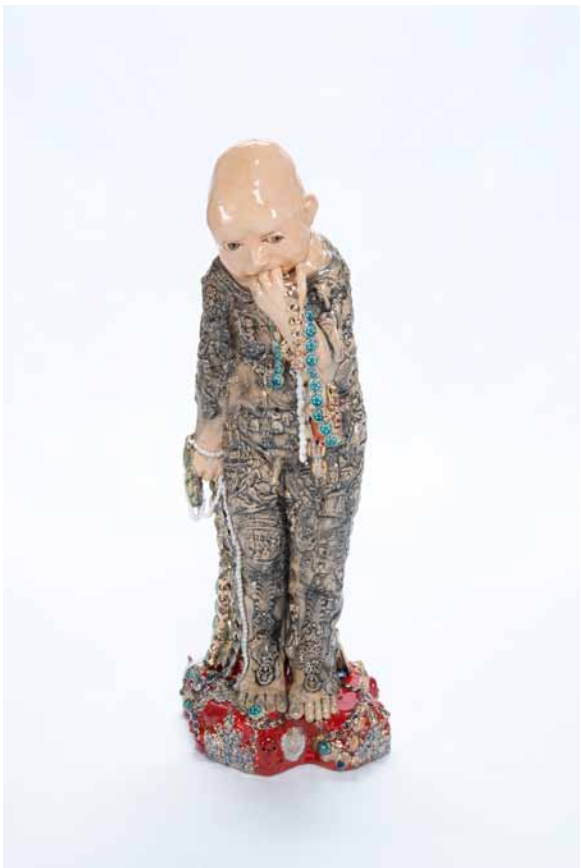
TATTOOED BABY WITH JEWELS (TATTOOBABY MET JUWELEN)

Faïence émaillée / Glazed earthenware ceramics Pièce unique. h 76 x l 29 x p 25 cm, 2017