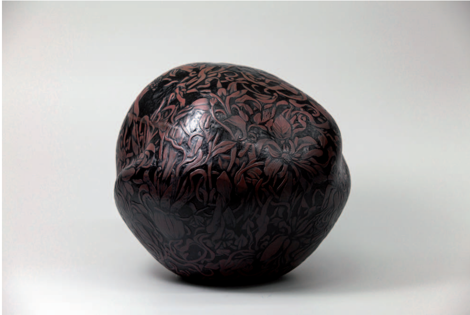
THE SPELL (RED) Verre soufflé et gravé à la main Hand blown and carved glass 26 x 26 x 26 cm, 2017