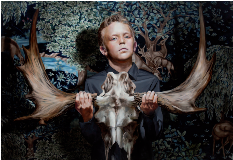
THE MASK (BOY HOLDING A MOOSE SKULL)

Huile sur toile / Oil on canvas 150 x 100 cm, 2017