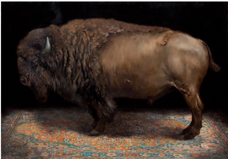
ON THE NIGHT OF THE BIG FREEZE (AMERICAN BUFFALO)

Huile sur toile / Oil on canvas 145 x 100 cm, 2017