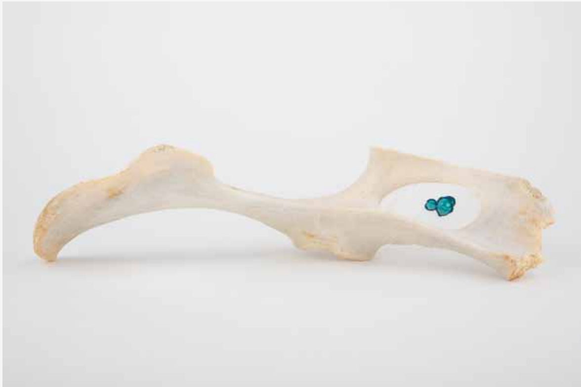
MARION CATUSSE Les enfants perdus Os, encre et colle, 11 cm, 2014