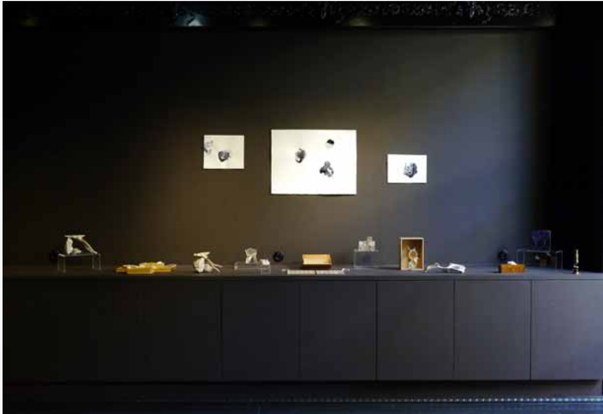
Vue de l'exposition 'Hypothesis for the origin' / Installation view