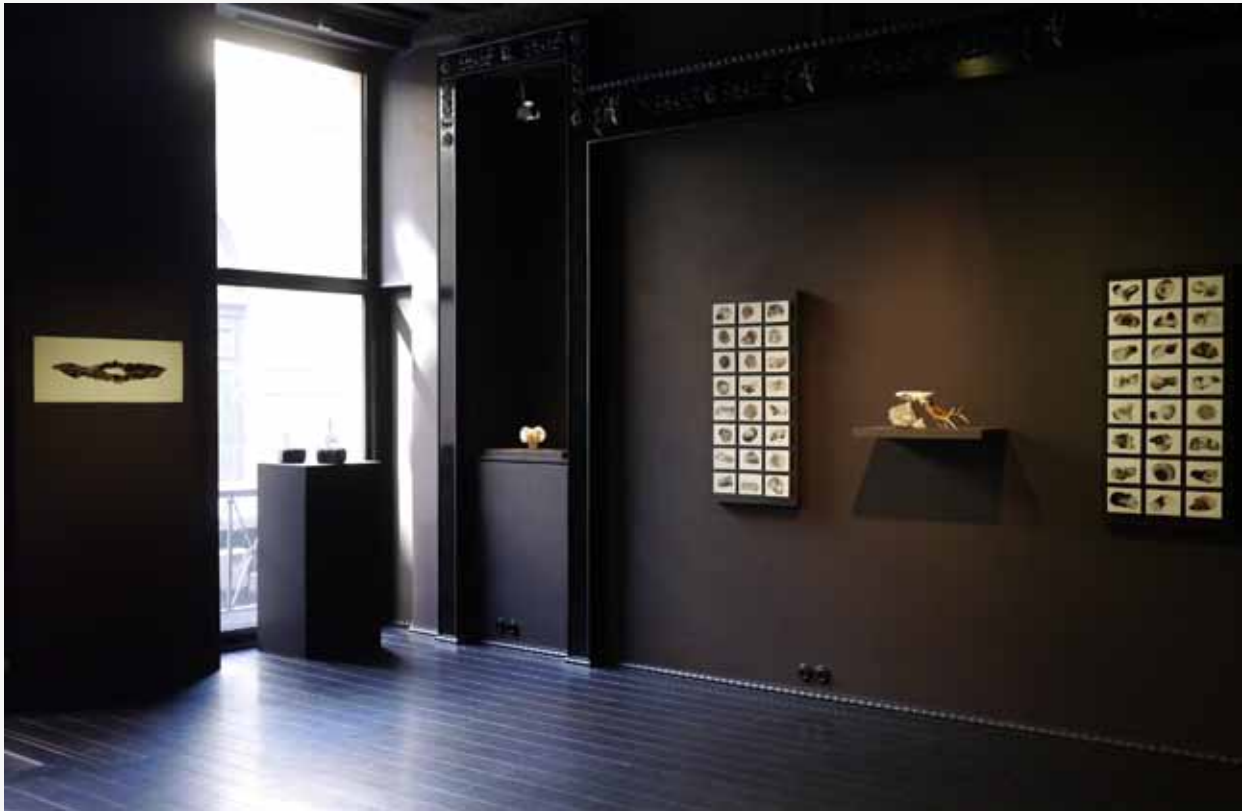
Vue de l'exposition 'Hypothesis for the origin' / Installation view