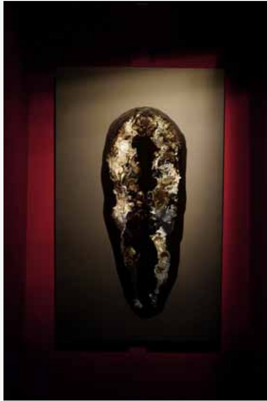
Vue de l'exposition 'Hypothesis for the origin' / Installation view