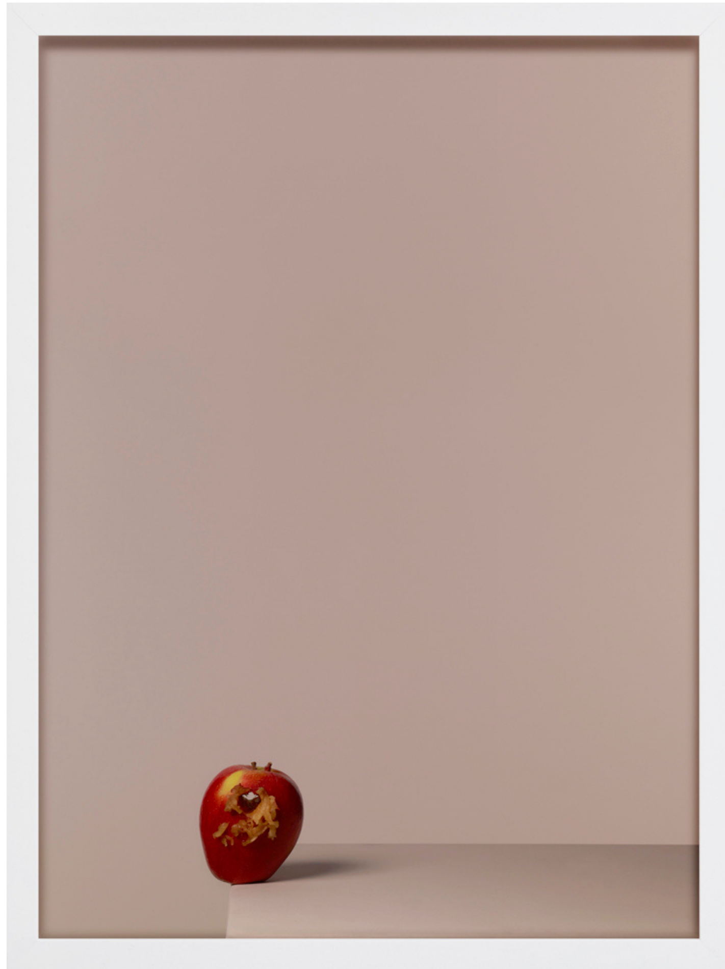
Le Péché, tirage d'archive à encre pigmentaire 64 x 85 cm, édition de 5, 2017