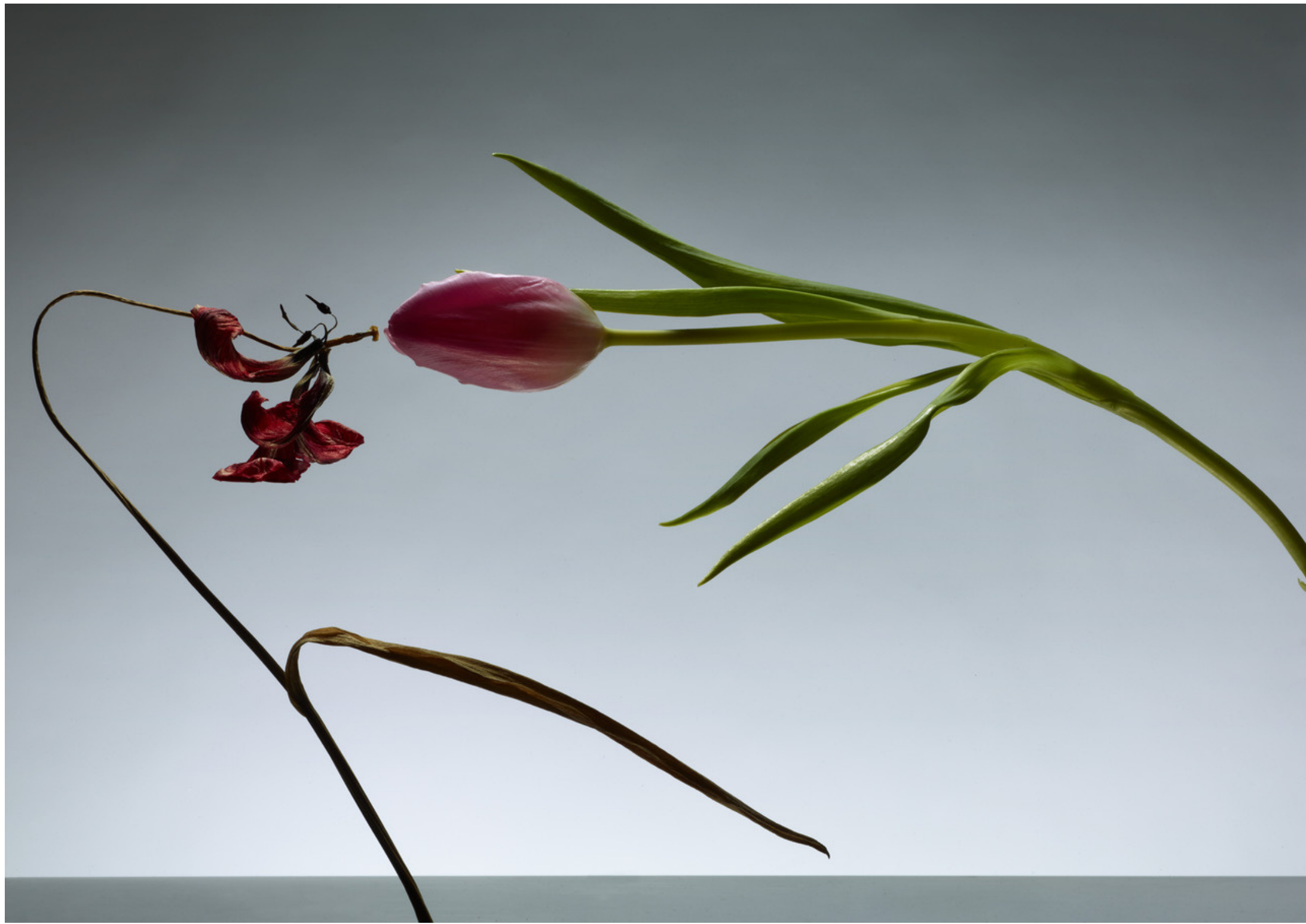
A perte de vue, N° 6 38,5 x 27 cm, jet d'encre sur papier kozo, 2021